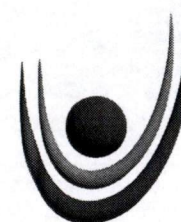
TABELA 05: COMPOSIÇÃO CPA Comissão Própria de Avaliação – CPA