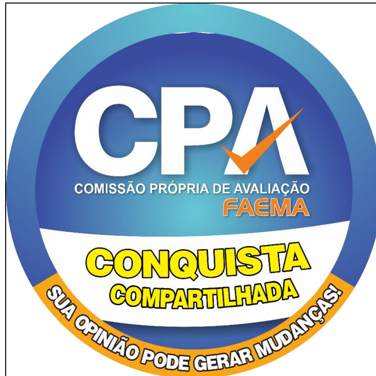
Figura 3: Selo CPA Conquista Compartilhada.

A criação do selo CPA – Conquista Compartilhada, fomenta o engajamento crescente da comunidade acadêmica em ser ativa no processo de avaliação institucional e consequente aperfeiçoamento provenientes das percepções obtidas.