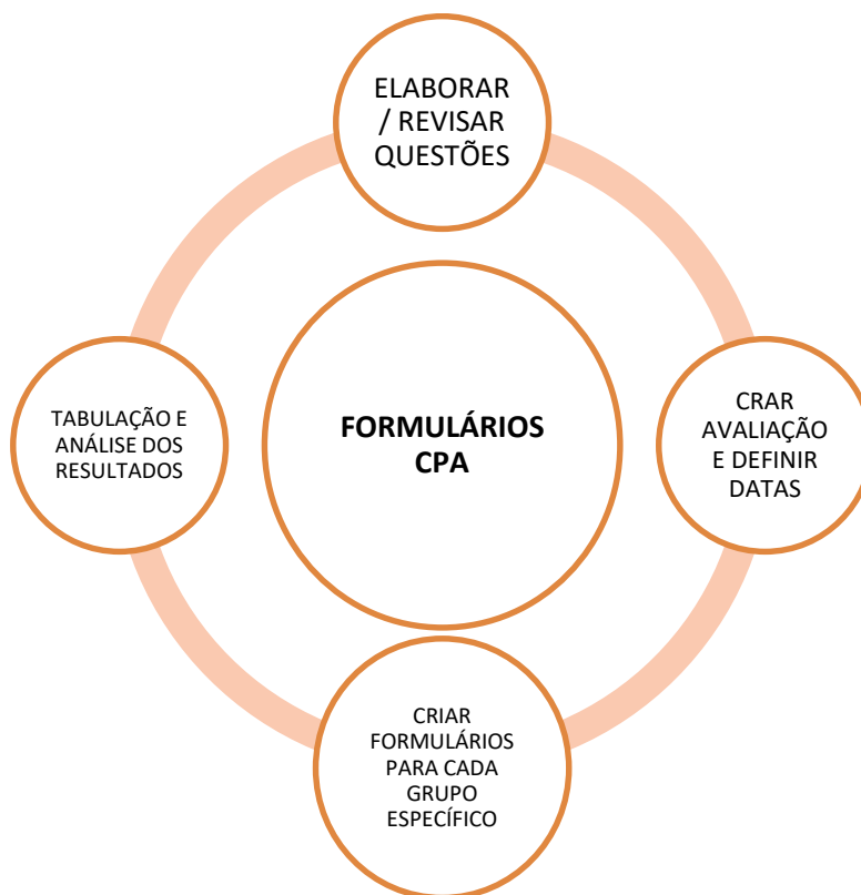
Figura 1: Fluxograma do processo de trabalho CPA

O preenchimento destes referidos instrumentos demandou a participação de todos os segmentos da comunidade acadêmica, em uma visão qualitativa, contextualizada e integrada. O mesmo permite expressar pontos de estrangulamento, potencialidades e propostas de melhorias, fazendo com que o processo de melhoria seja constante e permita a interação com a gestão acadêmica.